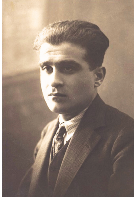
Gençliğinde Ahmet Hamdi Tanpınar