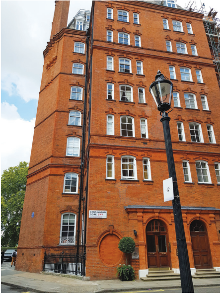
Sargent'in oturduğu Albert Hall Mansions

şehre gelir gelmez Londra'nın geleneksel "Proms" konserlerinden bir tanesine gitme fırsatını kaçırmamıştı. Konser Figaro'nun Düğünü Uvertürü ile açılmış ve bunu Mozart'ın Do minör K 388 Serenadı ve La Majör 23. Piyano Konçertosu takip etmişti. İkinci yarıda ise Mozart'ın Re Majör 38. "Prag" Senfonisi, Ravel'in Sol majör Piyano Konçertosu ile Daphnis et Chloé 'den 2. Süit yer almıştı. BBC Senfoni Orkestrası'nın ve Proms'un daimi şefi olarak Sargent'in o devre kariyerinin doruk noktasında olduğu düşünülürse Tanpınar'ın onu "bir yarım ilâh gibi" görmüş olduğuna şaşırılmak lazım.