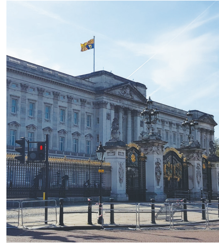
Kraliyet bayrağının dalgalandığı Buckingham Sarayı, (Fotoğraf Emre Aracı)

niteliğindedir. Üstelik Tanpınar 1953'te Londra'yı bir hayli festival havasında bulmuş olmalıydı, çünkü şehre varışından daha iki ay öncesinde, 2 Haziran günü, 26 yaşındaki Kraliçe II. Elizabeth Westminster Abbey'de gerçekleşen görkemli törende taç giymişti. Taç giyme töreninin kutlamaları bayraklarla, rengârenk flamarlarla ve kraliyet armalarıyla süslü şehirde hâlâ devam ediyordu. Hatta daha bir hafta öncesinde Sargent o yılın ikinci Prom konserinde Royal Albert Hall'da "Coronation" temalı Purcell, Handel ve Walton'ın eserlerinden oluşan bir program idare etmişti. O akşam eserler arasında Handel'in Kral II. George'un 1727'deki taç giyme töreni için bestelediği ve her dinleyişe insana ayaklarının yerden kesildiğini hissettiren Zadok the Priest "Coronation Anthem"i de seslendirilmişti. Bu "Anthem" in 1727'den beri her taç giyme töreninde seslendirilmesi artık değişmez bir gelenek haline alacaktı. Sargent 2 Haziran'da Westminster Abbey'deki törende hazır bulunduğu gibi tören sonrası sinemalarda gösterilen taç giyme merasiminin filminde kullanılan fon müziğinin kaydını da idare etti. Tam tamına 70 yıl sonra Tanpınar'la Londra sokaklarını dolaşırken bu defa