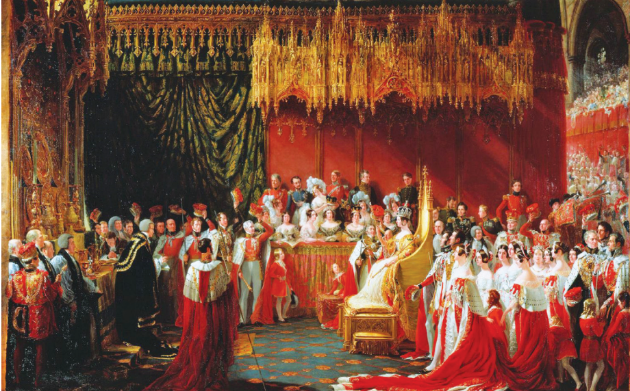
Kraliçe Viktorya'nın taç giyme töreni, (Sir George Hayter, 1838)

toplulukların müzisyenlerinden oluşturuldu. Bu vesileyle ortaya çıkan yeni bestelerin hangisinin daha uzun ömürlü olacağını bilemiyorsam da tarihi binaların heybetli kişilikleriyle modern yapılar arasında asaletle yükseldikleri şehir sokaklarında olduğu gibi Byrd, Gibbons, Handel, Elgar ve Parry'nin müziğinin Charles ve Camilla'nın taktığı o tarihi taşlardaki elmaslar gibi o törende parladıklarını görmemek doğrusu imkânsızdı. Törende yer alan Gospel korosu ve İstanbul kiliselerini anımsatan Bizans ilahileri ise beklenmedik sürprizlerdi. Taç giyme törenlerinde ünlü müzisyenlerin görev almaları çok olağan. Örneğin Kraliçe Victoria 19 yaşında Westminster Abbey'de taç giydiğinde müzik direktörü Sir George Smart idi. Smart, Beethoven ve Weber'i çok iyi tanırdı. 1851'de Crystal Palace'ta açılan Uluslararası Sergi'nin müzik direktörlüğünü de o üstlenmişti. 1867'de bu sergi binasında Sultan Abdülaziz 1600 kişilik dev İngiliz korosunun kendi onuruna Türkçe dilinde söylediği Luigi Arditi'nin Türk kantatı Inno Turco 'sunu dinlemişti. Andante 'de daha önce hikâyesini pek çok defalar kaleme aldığım