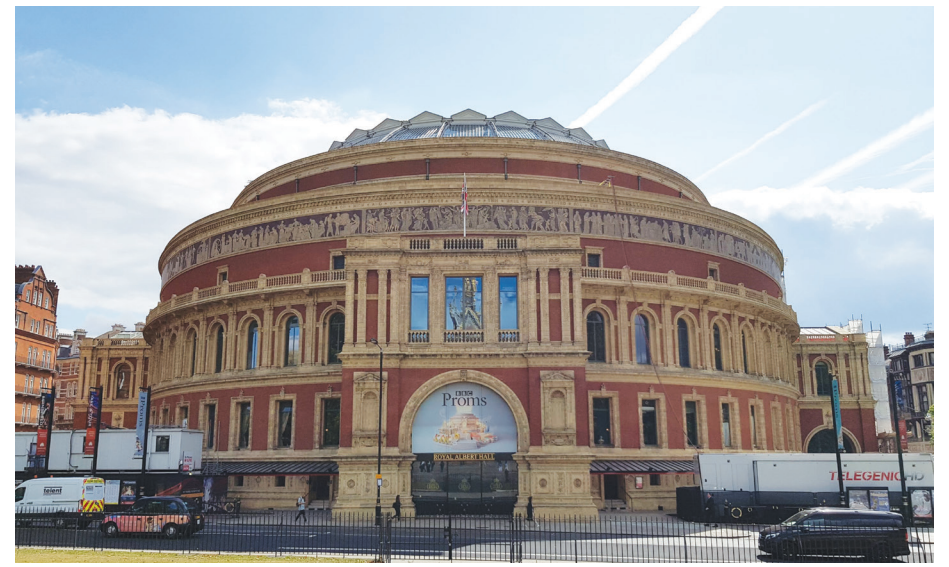
'Proms' zamanı Royal Albert Hall