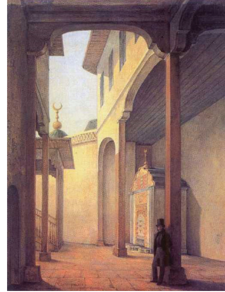
Alexander Puşkin Bahçesaray Çeşmesi'nde, (Grigory Chertnetsov)