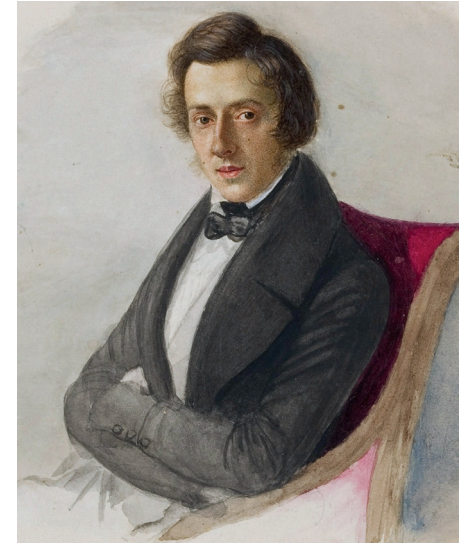
Frederick Chopin (Maria Wodzinska, 1835)Turner, 1829)

Gerçi Franz Liszt de o dönemde yolu Durham'dan geçmiş, çağının önemli müzisyenleri arasındaydı. Gazete sayfalarındaki ilanlarından da gördüğüm üzere, 26 Ocak 1841 akşamı Liszt şehrin tiyatrosunda bir konser vermişti. O sırada Macar virtüöz Edinburgh'dan Londra'ya dönüyordu ve hemen hemen geçtiği her şehirde piyano resitaleri veriyordu. Northumberland'daki Alnwick kasabasından da geçmiş ve o gece burada bir handa konaklamıştı. Liszt'i de hatırlayarak bu seyahatimde Northumberland Dükü'nün evi olan Alnwick Kalesi'ni gezip Turner'ın mehtaplı bir gecede burayı betimlediği tablosunu da gözümün önünde canlandırarak Edinburgh'a da kısa bir ziyaret gerçekleştirdim. Kuzey İngiltere, İskoçya sınırına yakın olmasından ötürü, makalemin girişinde de belirttiğim gibi, gerçekten de bu seyahatte görme fırsatını bulduğum Bamburgh ve Warkworth gibi romantik kaleler diyarı. Hele buraları böylesine kıymetli müzisyenlerin rehberliğinde geziyor olmak yolculuğuma apayrı bir boyut kattı diyebilirim. Nitekim Mendelssohn'un izinde Edinburgh'u daha önce Andante sayfalarında anlattığım için ('Mendelssohn'un izinde Londra'dan Abbotsford'a doğru', Ekim 2017,