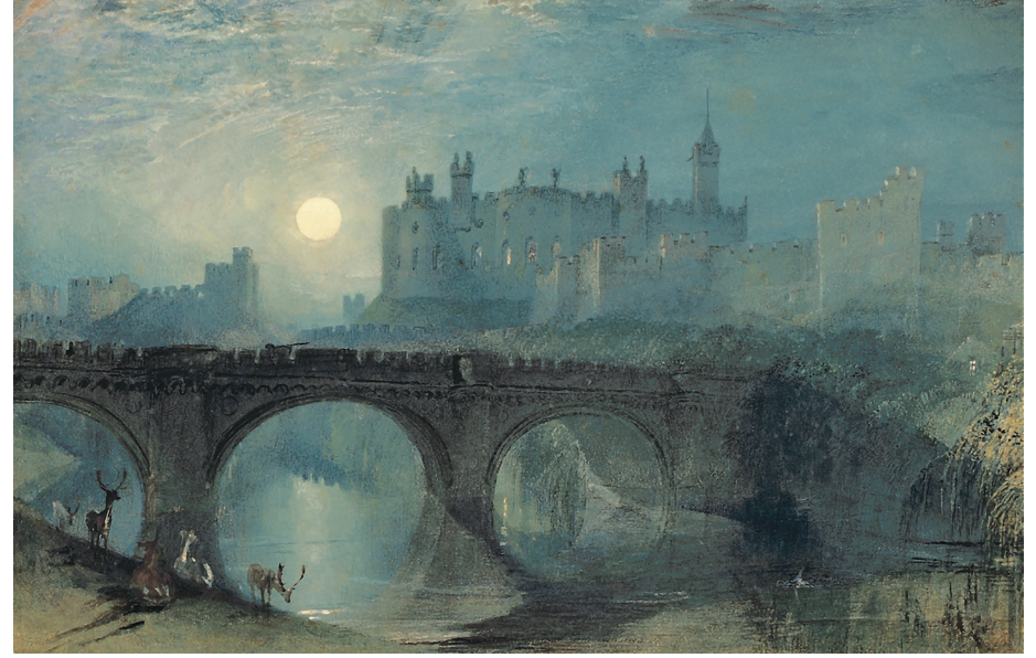
Northumberland'daki Alnwick Kalesi, (J. M. W. Turner, 1829)