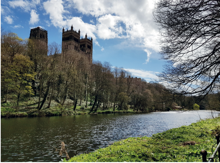
Wear Irmağı kıyısından Durham Katedrali'ne bakış