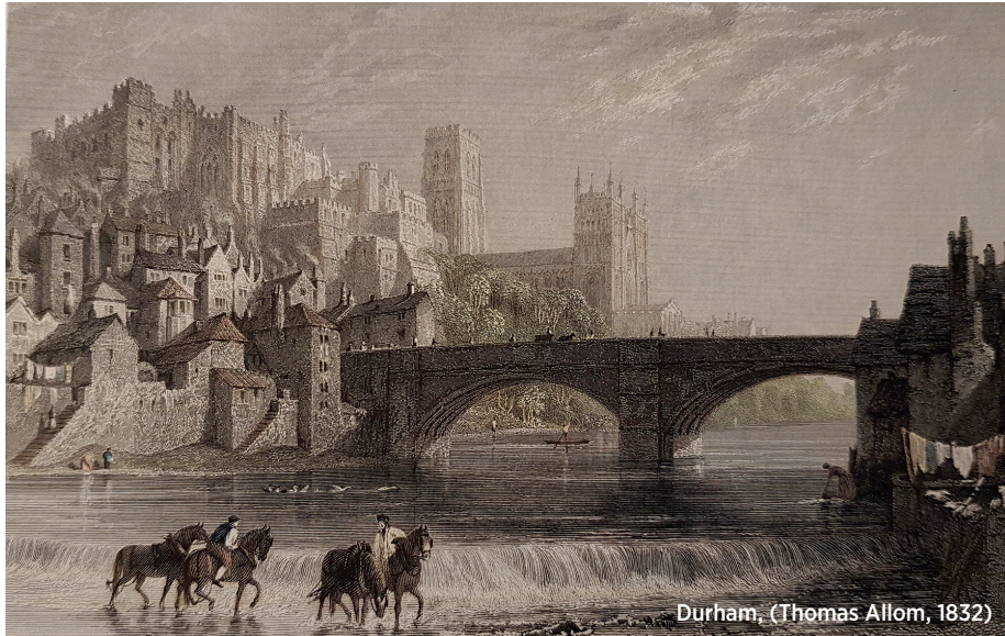
Durham, (Thomas Allom, 1832)

Wear Irmağı kıyısında tek başıma yürürken ve tepelere tırmanan bir ormanın içerisinden kuleleri yükselen o Gotik katedralden