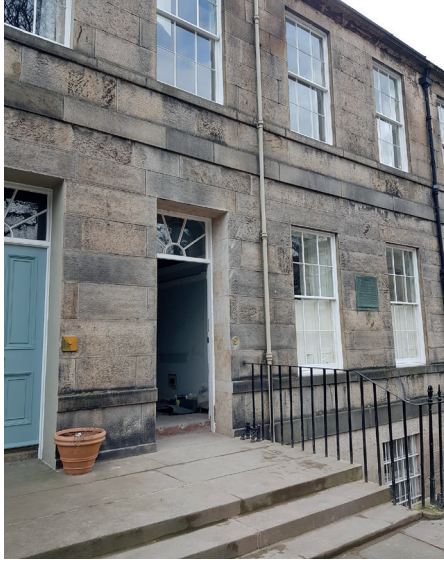
Chopin'in Edinburgh'da kaldığı 10 Warriston Crescent, (Fotoğraf: Emre Aracı)