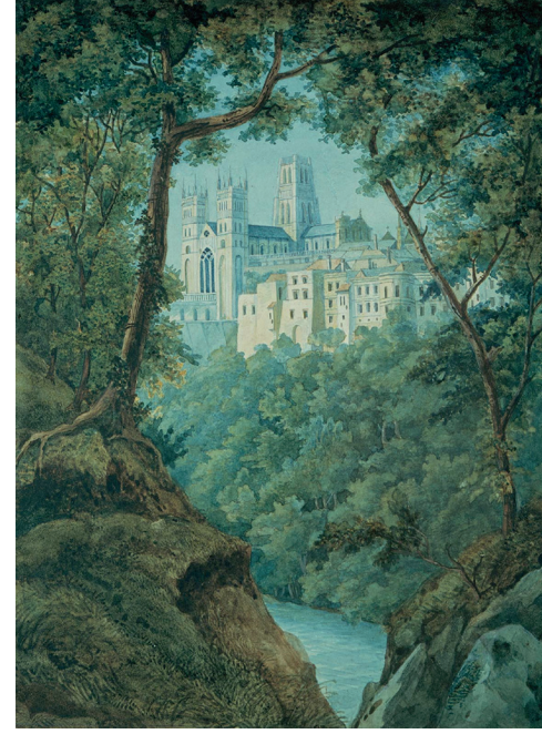
Mendelssohn'un fırçasından Durham Katedrali

yankılanan çan seslerine kulak verirken Prebends Köprüsü'nün suya akseden kirişlerinde zamanın durduğu ender yerlerden biriydi burası. Sonrasında buranın eski resimlerini ararken Felix Mendelssohn'un bir tablosuyla karşılaşacaktım. Çünkü Mendelssohn da 1829 yılında çıktığı İskoçya seyahatinde, 24 Temmuz günü Durham'dan geçerken, benim o katedrale uzun uzun baktığım aynı köşeye oturup kara kalem çizimlerini yapmış ve bir sene sonra o çizimlerinden bir suluboya tablo yaratmıştı. Bunu görünce üzerinde Sir Walter Scott'un "Durham'ın gri kuleleri"yle açılan bir şiirinden bir beyitin yer aldığı Prebends Köprüsü'ne doğru Wear Irmağı kıyısında yapmış olduğum o yürüyüş benim için daha da özel bir anlam kazanacaktı. Zira artık sadece Durham Katedrali'ne bakmakla kalmıyor, Scott'un şiirinde ölümsüzleştirdiği, Mendelssohn'un da görüp heyecan duyduğu o manzarayı onların gözlerinden tadıyordum. Hem de 21. yüzyılda ve onlar gibi kendi çağından yalın bir seyyah olarak.