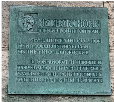
10 Warriston Crescent'in duvarındaki anı plaketi

tanıdığı gibi, Chopin 1832'de Paris'te ilk resitalini verdiği zaman hem Mendelssohn hem de Liszt dinleyiciler arasındaydı. Chopin'in Mendelssohn'a özel bir sevgisi vardı. Zira 1845 Ekim'inde ona yolladığı bir mektubunu "Daha değerli ve daha yakın dostlarımız ve hayranlarımız olsa bile, kimsenin benden daha samimi olmadığını hatırlatmama izin verir" cümlesiyle kapatacağı. Baskısı tükenmiş de olsa Chopin'in 1848'deki İskoçya seyahatini anlatan çok güzel bir kitap daha var: Iwo ve Pamela Zaluski'nin kaleminden çıkma, 1993'te yayımlanmış olan, The Scottish Au-