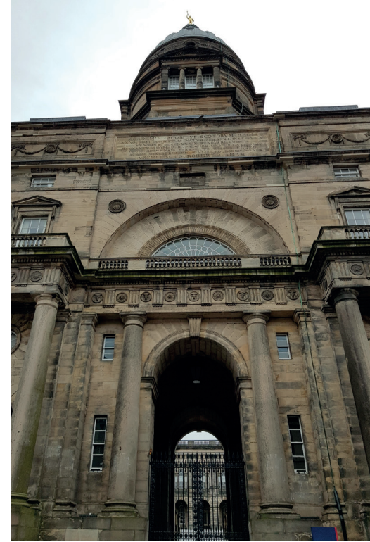
Old College, Edinburgh Üniversitesi