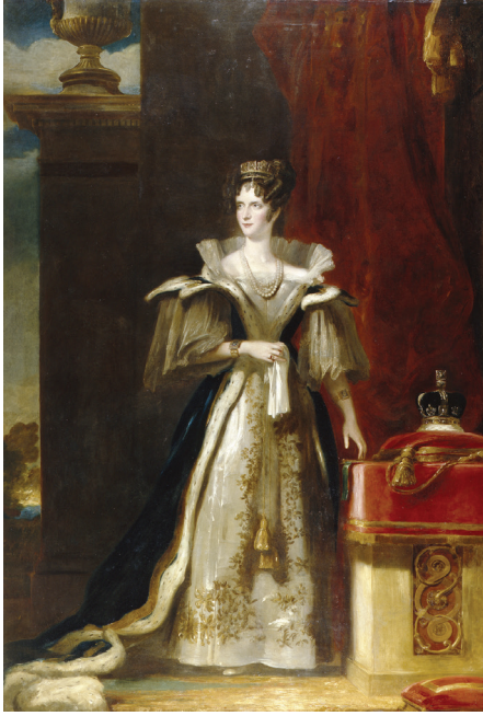
Kraliçe Adelaide, (John Simpson, 1832, Brighton & Hove Museums)

Lord Burghersh'in diğer Türk operası ise 22 Nisan 1830'da Palazzo Ximenes'de sahnelenen ve Catherine olarak da bilinen L'Assedio di Belgrade (Belgrad Kuşatması) idi. Andante 'nin 199. sayısında da aktarmış olduğum gibi Burghersh'in bu operası, onun da çok iyi bildiği, Stephen Storaçe'nin aynı adlı pastiş operası üzerine bestelenmişti. Yani bir pastişten bir başka pastiş ortaya çıkmıştı. Zira Lord Burghersh'in kütüphanesinden