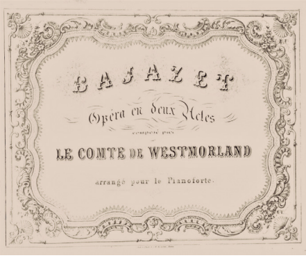
Westmorland Kontu'nun 'Bajazet' (Bayezid) operası, (The British Library)

s. 3). Belki de aynı yıl kurulmasına vesile olduğu Kraliyet Müzik Akademisi'nde gelecekte yetiştirilecek olan kıymetli müzisyenlerle Lord Burghersh zaten şöhret tapınağındaki yerini mütevazı bir şekilde rezerve etmiş sayılırdı.