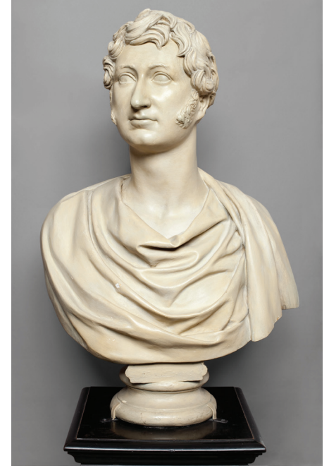
Westmorland Kontu'nun büstü, (Lorenzo Bartolini (atfen), Royal Academy of Music)

hazretlerinin kütüphanesinin bir zamanlar bulunduğu Apethorpe Hall malikânesine çekiyor. Çünkü bu nota başta Lord Burghersh olmak üzere sayfalarını çeviren insanların tilsimini bana taşıyor. Lord Burghersh Catherine operasını Kraliçe Adelaide'a ithaf etmişti ve opera 6 Kasım 1830'da Londra'da King's Theatre'da Kral IV. William ve Kraliçe Ade-