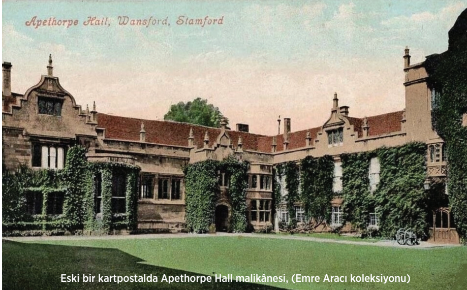
Eski bir kartpostalda Apethorpe Hall malikânesi

çıkma, cilt kapağında adının altın yaldızla yazılı olduğu Storaçe'nin The Siege of Belgrade operasının 1791 tarihli matbu notası şu an masamda duruyor ve beni bir miktatsız gibi Londra'dan Floransa'ya ve oradan da Kont