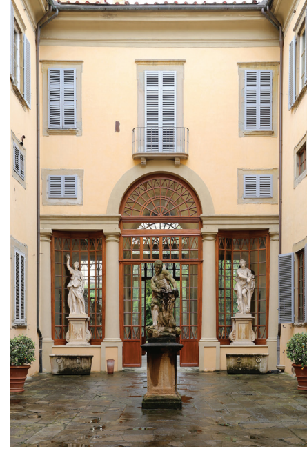
Floransa'daki Palazzo Ximenes'in avlusu, (Fotoğraf: Sailco, Wikipedia)