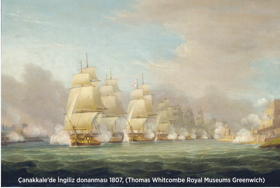
Çanakkale'de İngiliz donanması 1807, (Thomas Whitcombe Royal Museums Greenwich)

uzaktan gördüğü İstanbul silüeti şuuruna işlenmiş olarak ülkesine geri dönecekti.