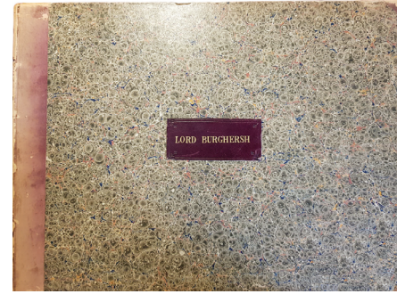
Lord Burghersh'in kütüphanesinden 'Belgrad Kuşatması'

hazretlerinin kütüphanesinin bir zamanlar bulunduğu Apethorpe Hall malikânesine çekiyor. Çünkü bu nota başta Lord Burghersh olmak üzere sayfalarını çeviren insanların tilsimini bana taşıyor. Lord Burghersh Catherine operasını Kraliçe Adelaide'a ithaf etmişti ve opera 6 Kasım 1830'da Londra'da King's Theatre'da Kral IV. William ve Kraliçe Ade-