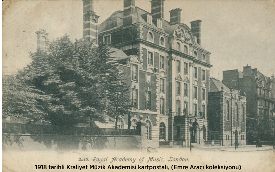
2510. Royal Academy of Music, London.

hatıralara taşımış olmalıydı? Zira kartpostalda inşaatı 1911'de tamamlanmış olan ve planlarını mimar Sir Ernest George'un çizdiği Londra'nın Marylebone semtindeki Royal Academy of Music, yani Kraliyet Müzik Akademisi binası güneşli ve huzurlu bir Londra gününde görülüyor. Önündeki gaz fenerleri hariç, bugün de aynı bina değişmeyen Londra'da o sepia kartpostal gibi aynen saklı kalmış. Belki de beni Londra'ya çeken de işte bu süreklilik olsa gerek. Yanımda götürdüğüm kartpostalı o manzaraya tuttuğum zaman o sepia fotoğrafın bir anda renklendiğine tanık olmanın verdiği iç huzuru da denebilir buna; çünkü o fotoğraf renklendiğinde hatıralar da