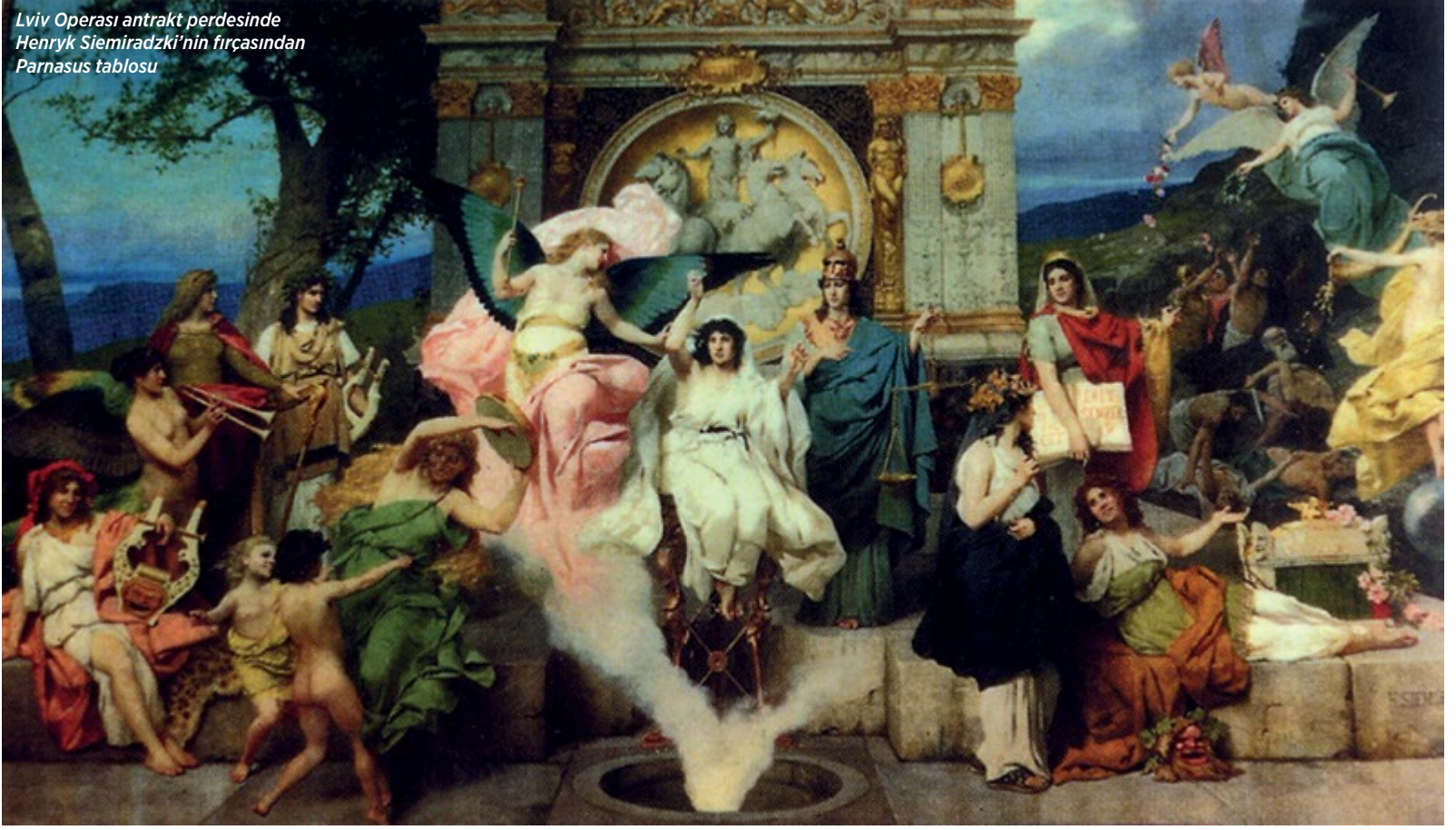
Lviv Operası antrakt perdesinde Henryk Siemiradzki'nin fırçasından Parnasus tablosu