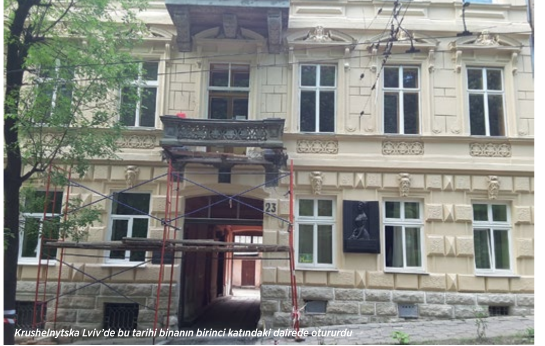
Krushelnytska Lviv'de bu tarihi binanın birinci katındaki dairede otururdu

22 Mayıs 2016 Pazar günü şehirden ayrılmadan önce hızlı adımlarla bu daireyi ziyarete gittim. Eski bir imparatorluk şehrinin binalarının çoğunun cepheleri yorgundu yorgun olmasına, heykellerle bezeli balkonlarda, çatılarda sanki tiyatro oyunları oynanıyor gibiydi, dev kanatlı kartallar balkonları omuzlarında taşıyorlardı, ama kimse bu tarihi binaları yıkıp aslına uygun şekilde, sözüm ona “restore” ederek, ruhlarını söküp almamıştı, ya da yerlerine Alışveriş Merkezleri dikmemişti. Krushelnytska'nın dairesinin bulunduğu binanın önüne geldiğimde ise heyecanla birinci kata çıktım ve kapı zilini çaldım; kapıda isminin yazılı olduğu levha dahi yerli yerinde duruyordu ve sanki o kapı açılınca kendisi karşıma çıkacaktı. Ama ne yazık ki defalarca zili çalmama rağmen o kapı hiç açılmadı ve öylece apartmanın loş döner merdivenlerinden aşağı inerek binadan ayrıldım. Sonradan öğrendim ki Krushelnytska'nın dairesinde “restorasyon” çalışması yapılıyordu ve müze geçici olarak ziyarete kapatılmıştı. Yine de onun izinde gitmek, o parkın yanında yürüyerek bir zamanlar oturduğu apartmanın birinci dairesine çıkan o merdivenleri çıkıp inmek bana huzur vermişti.