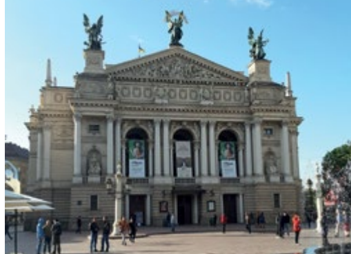
Polonyalı mimar Zygmunt Gorgolewski'nin eseri olan Lviv Operası