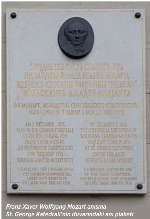
Franz Xaver Wolfgang Mozart anısına St. George Katedrali'nin duvarındaki anı plaketi