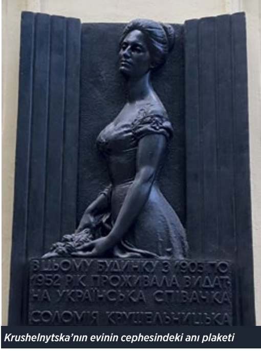
Krushelnytska'nın evinin cephesindeki anı plaketi