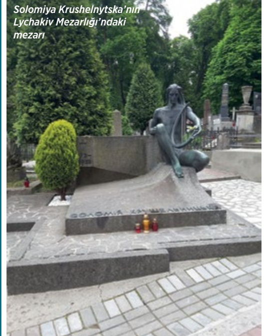
Solomiya Krushelnytska’nın Lychakiv Mezarlığı’ndaki mezarı

Lychakiv’de çok kısıtlı vaktim olduğu için bana Paris’teki Père Lachaise’i hatırlatan bu tarihi mezarlığı tamamen gezme imkanım ne yazık ki olmadı. Üstelik 1787’de açılan ve bugün o görkemli Gotik kapısından girilir girilmez dramatik heykelleriyle bir açık hava müzesini andıran Lychakiv, Père Lachaise’den ve Londra’nın Highgate’inden daha da eski bir mezarlık. Esasında Lviv’de böylesine tarihi bir mezarlıkla karşılaştığım için şaşırıyorum; zira Avusturya İmparatorluğu’nun yanısıra bir süre de Polonya himayesi altında kalmış olan ve Rus mimarisinin hakim olduğu Kiev’e kıyasla daha çok Viyana, ya da Prag sokaklarını andıran birbirinden