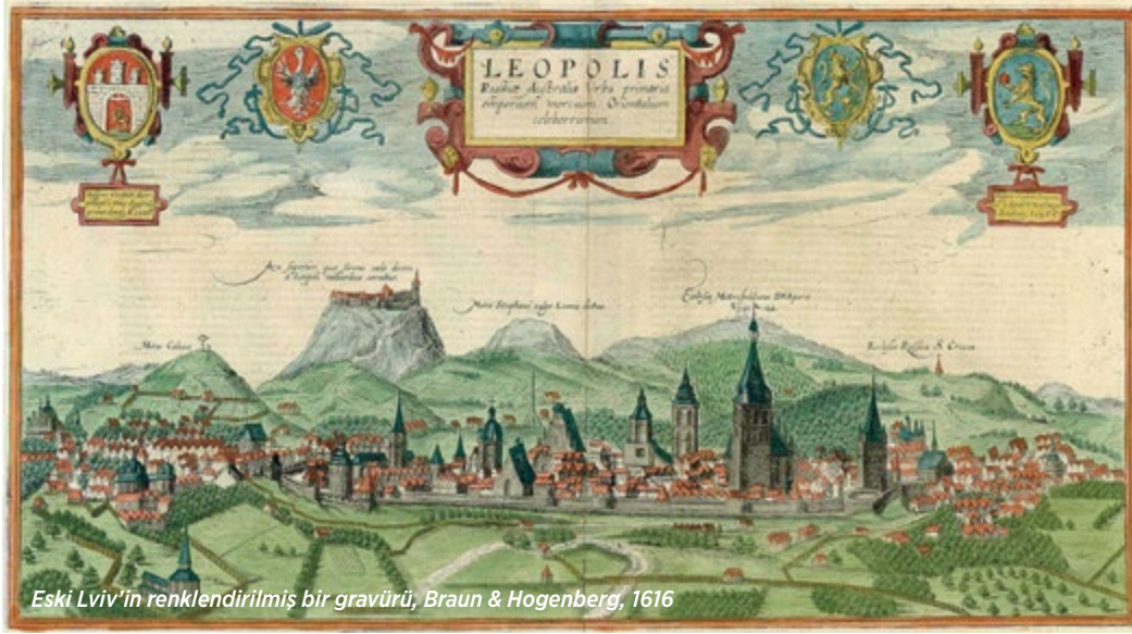
Eski Lviv'in renklendirilmiş bir gravürü, Braun & Hogenberg, 1616