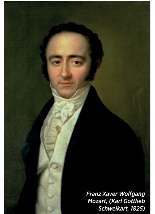
Franz Xaver Wolfgang Mozart, (Karl Gottlieb Schweikart, 1825)