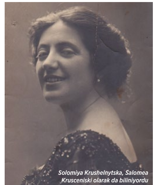
Solomiya Krushelnytska, Salomea Krusceniski olarak da biliniyordu

Krushelnytska opera sahnelerinden çekildikten sonra 1939'da Lviv'e geri döndü ve konservatuvarda ders vermeye başladı; ama şehrine II. Dünya Savaşı'nın kara bulutları çoktan çökmüştü; Polonya, Nazi Almanyası ve Stalin Rusyası arasında bölüşülürken önce Ruslar Lviv'i işgal ettiler, ardından Almanya Molotov-Ribbentrop Paktı'nı ihlal edince, bu defa da Nazi güçleri şehre girdiler. II. Dünya Savaşı'ndan sonra ise Churchill'in bütün itirazlarına rağmen Lviv Sovyetler Briliği sınırları içerisinde kaldı. Krushelnytska 16 Kasım 1952'deki vefatına kadar bütün bu değişim sürecini birebir yaşadı. Ama bütün bu felaketselere rağmen bir şey hâlâ yerli yerinde duruyordu: Ivan Franko Parkı'na bakan ve bugün kendi adıyla anılan sokak üzerinde, 23 numarada Lviv günlerini geçirdiği apartman dairesi.