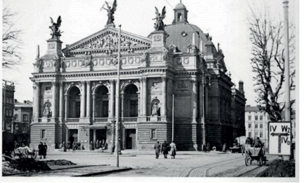
Eski bir fotoğrafta Lviv'in tarihi opera binası

operasının Milano'daki başarısız prömiyerinden sonra ikinci temsilde Cio-Cio San rolünde sahneye çıkarak gösterdiği başarılı performansla bir tür operanın kurtarıcısı haline dönüşmüş olmasıydı. Hatta bu tarihi olay seneler sonra Myroslav Skoryk'e The Return of Butterfly balesini yaratma ilhamını verecekti.