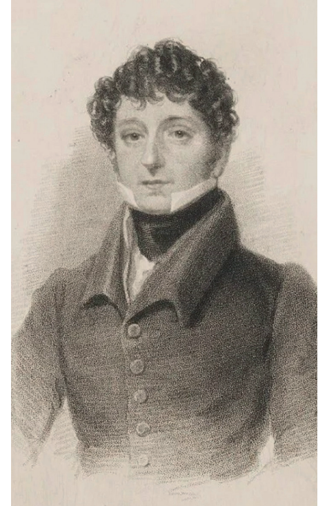
St. James's Tiyatrosu'nu inşa ettiren tenor John Braham

Belki de bana İstanbul'daki çağdaş olan Naum Tiyatrosu'nun tarihçesini kaleme aldığım günleri hatırlattığı için ve bir tiyatro binasının biyografisinde, adeta minyatür bir halde, bir insan ömrünün inişli çıkışlı, mutlu mutsuz, umutlu, umutsuz bütün unsurlarını en ince ayrıntısına kadar bulabildiğim için böylesine bir biyografi beni cezbediyor. Londra'da bugüne ulaşmayı başarmış onlarca tarihi tiyatro binası var ve hepsi de birbirinden görkemli, heybetli, kişilikli ve enteresan hikâyeleriyle birer şahsiyet olarak şehrin köşebaşlarını, sokak ve caddelerini tutmuş durumdadır, ama ne yazık ki St. James's Tiyatrosu bunlar arasında değil, çünkü bu tiyatro rant uğruna 1957 yılında yıkılıp gitmiş. Ve üstelik