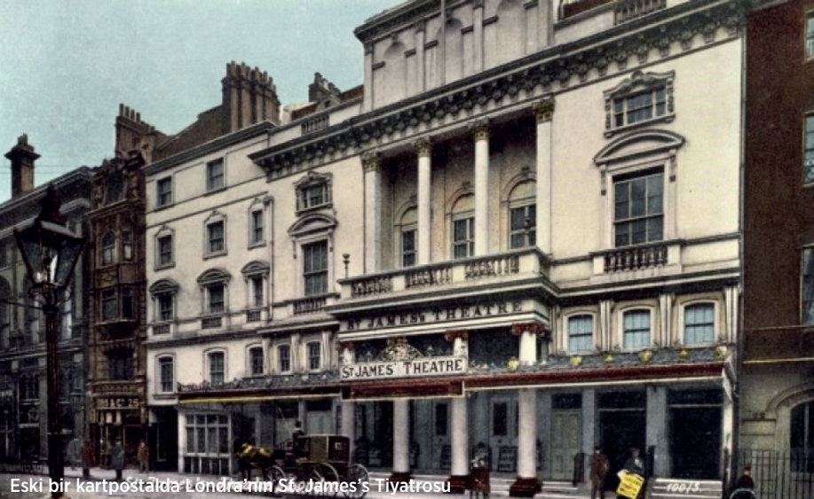
Eski bir kartpostalda Londra'nın St. James's Tiyatrosu

gerçekleşiyordu bu açılış. Yine de işçiler hâlâ binada çalışıyor, çekic gürtlüsü, fırçalama ve cilalama sesleri duyuluyordu; orkestra, George Stansbury'nin idaresi altında prova yapıyordu; sahne ressamı on beşinci yüzyıl şatosunun dekor tuvaline son rötuşları koyuyordu; oyuncu grupları çekildikleri köşelerde birbirlerinin repliklerini duyuyordu. Vernik, ıslak boya ve yeni kesilmiş ahşabın kokusu, lobide yanık kereste kokusuyla karışıyordu”, (Barry Duncan, The St. James's Theatre , Londra, 1964, s. 1). Neredeyse 200 sene sonra soğuk bir Aralık günü aynı Londra'nın aynı sokaklarını bu satırlar eşliğinde dolaşmak, Serpentine gölünün yanından geçip St.