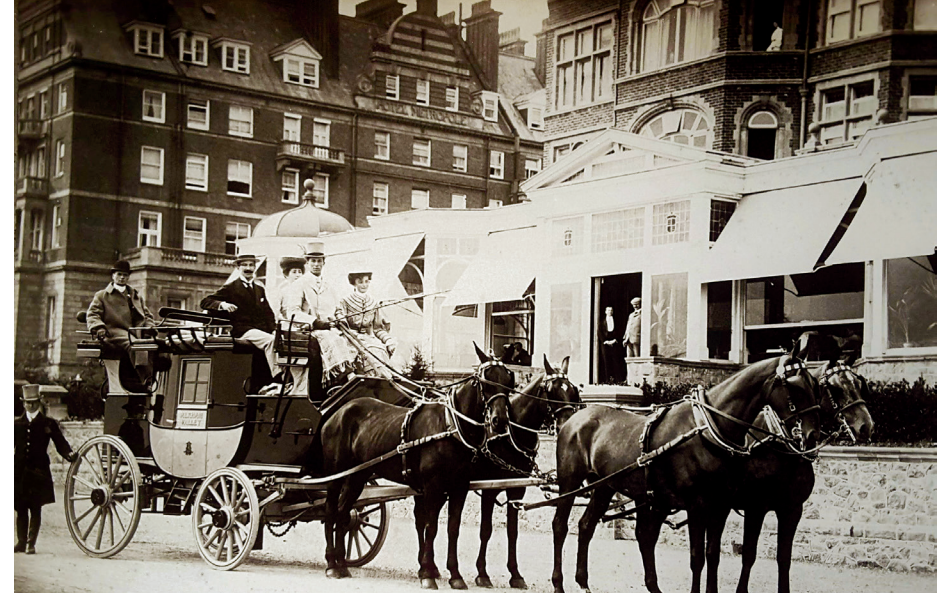
Folkestone'daki Grand Otel'in kapısından kalkan dört atlı araba, 1900'ler