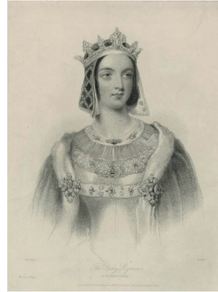
Somerset Düşesi Lady Georgiana Seymour

John Braham devrinin ünlü bestecilerini de yakından tanıdı ve önemli prömiyerlerde rol almıştı. Nitekim Carl Maria von Weber'in güzel aryaları, büyüleyici orkestrasyonu ve "sihirli korno" tınlarıyla Alman Romantik operasının gelişimine etki eden, Oberon operasının 12 Nisan 1829'da Covent Garden'da gerçekleşen dünya prömiyerinde Huon ro-