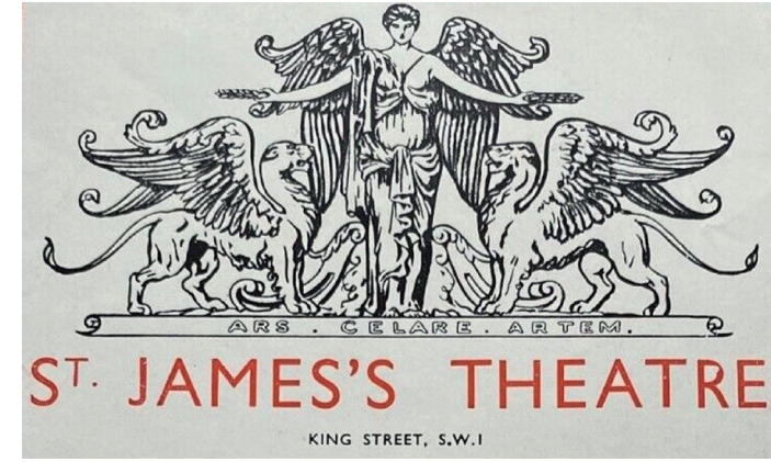
St. James's Tiyatrosu'nun arması

Bütün bu bağlantılar soğuk bir Noel mevsimi Londra sokaklarını tek başıma yürürken yerinde sevimsiz bir binanın yükseldiği St. James's Tiyatrosu'nun King Street'te kalan