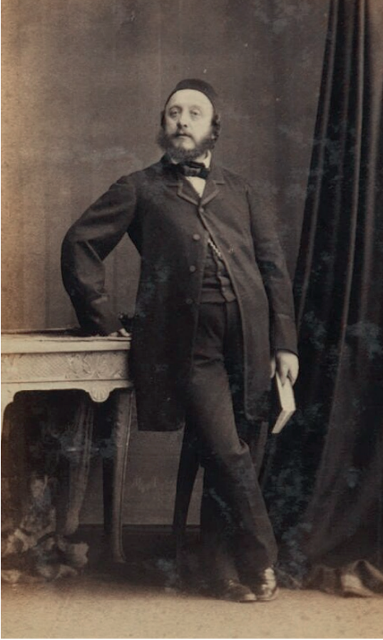
Osmanlı'nın Londra sefiri Kostaki Musurus Bey, (Milli Portre Galerisi, Londra)

lambaları, hanımların parlayan mücevherleri ve erkeklerin nişanları üzerine ışıltılı bir ışık saçıyor, koltukların ve balkonların altın süslemelerini, duvarların yumuşak beyazını, perdelerin derin kırmızısını aydınlatıyordu”.