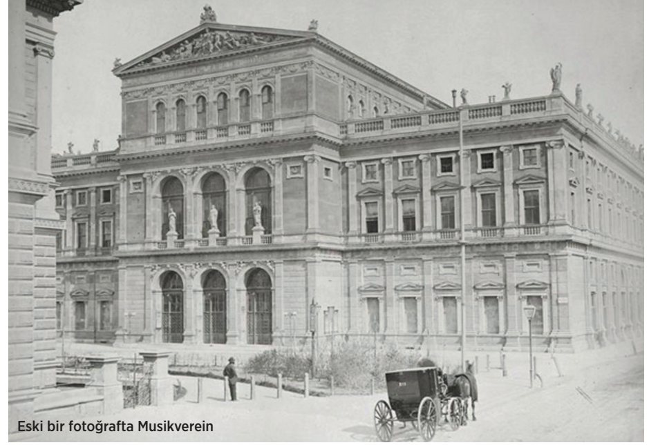
Eski bir fotoğrafta Musikverein

Musikverein'in bir tapınak havasındaki altın salonunun inşaatı İmparator Franz Josef'in Viyana'da 1857'de gerçekleştirmeye başladığı bir dizi imar hareketleri sonucunda hayat bulacaktı. O yıl Viyana'nın eski şehir surları yıktırılmış ve yerine Ringstrasse olarak bilinen birbirlerine bağlı dairesel bulvarlar inşa edilmişti. 1863'te İmparator, Karls-