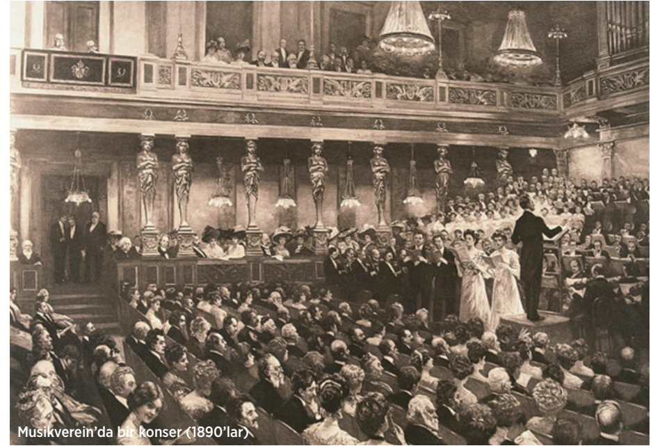
Musikverein'da bir konser (1890'lar)

kirche karşısındaki arsaya kendilerine modern ve yeni bir konser salonu inşa etmeleri için Gesellschaft Musikfreunde olarak bilinen Viyana'nın Müzik Dostları Derneği'ne verdi. 1812'de kurulan dernek o tarihten beri şehir-