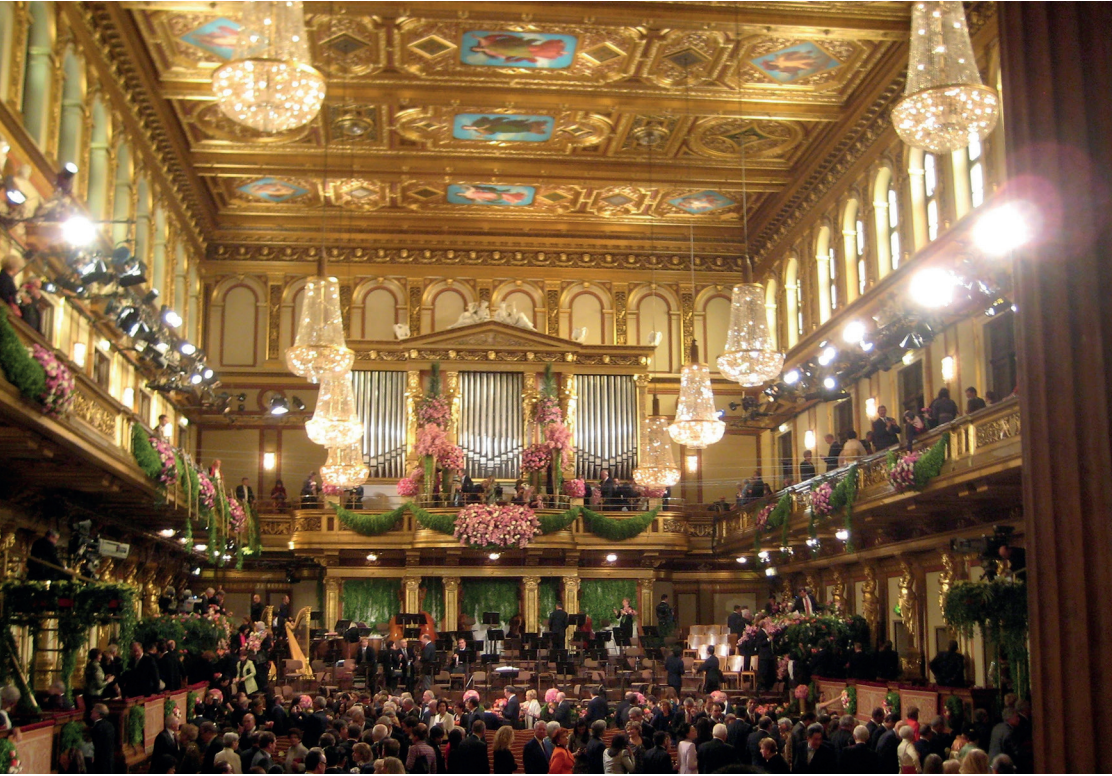
Musikverein'da Yeni Yıl Konseri, 1 Ocak 2011