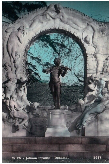
WIEN - Johann Strauss - Denkmal 5017

Esasında Strauss'un ölümünün ardından besteleri de Viyana Filarmoni Orkestrası'nın konser repertuarında artık yer almaz olacaktı. Ta ki 1921'de Viyana'nın Stadtpark'ında bestecinin o ünlü heykeli açılıncaya kadar. Strauss anısına bir heykel yaptırmak düşüncesi ilk olarak 1903'te gündeme gelmiş, ancak yeterli maddi kaynak sağlanamayınca ve araya I. Dünya Savaşı girince uzun yıllar bu teşebbüs sonuç vermemişti. Savaş sonrası yeterli bütçe sağlanınca Goethe anıtını da yapan heykeltıraş Edmund Hellmer'in eseri olan Strauss heykeli en nihayet 1921'de