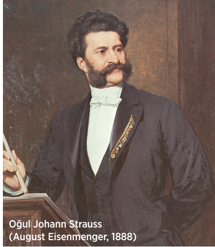
Oğul Johann Strauss (August Eisenmenger, 1888)

Bence Barenboim'in bu kıymetli sözleri, sadece Covid felaketi için değil, tabiatlarında mevcut olan pek çok farklı seslerle hayatın o renkli armonisini tek bir vücut hâlinde bir