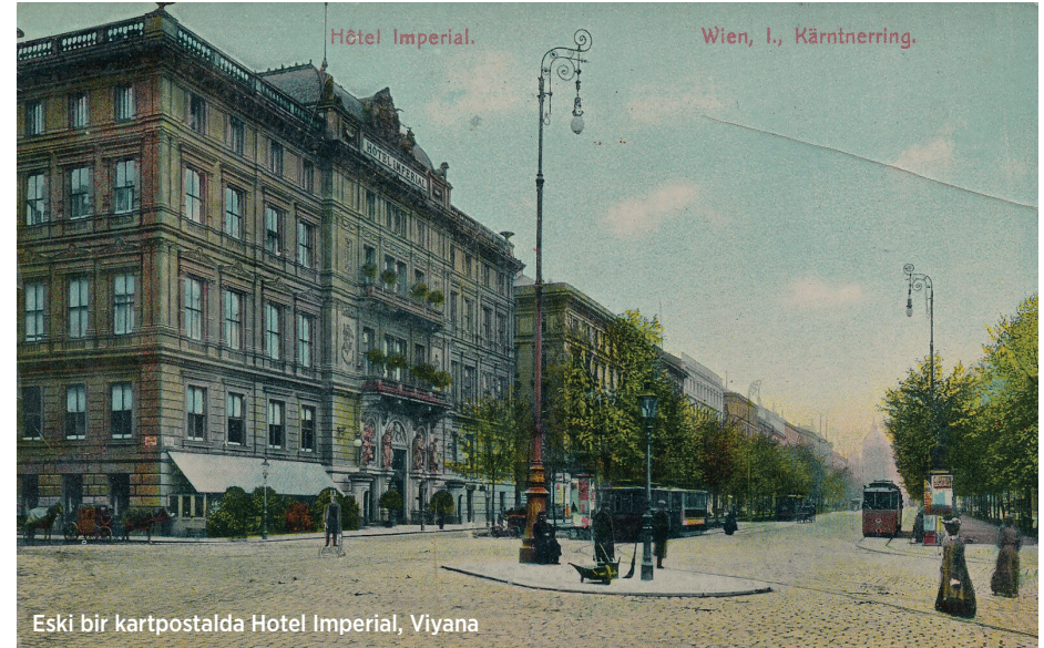
Eski bir kartpostalda Hotel Imperial, Viyana

İstanbul'daki evimde TRT'de ilk izlediğim Viyana Yeni Yıl Konseri'ni Lorin Maazel idare ediyordu. Aradan 30 yıl geçmiş, 2010 Aralık ayının son günleriydi. Yeni yıl için annemle Viyana'ya gitmiştik. Yılbaşından birkaç gün önce tesadüfen girdiğimiz bir bilet acentesinde Musikverein'daki yeni yıl konseri için bilet olduğu bilgisi kulağıma çaldı. O an kulaklarıma inanmadıysam da bilgi doğruduydu. Zira Musikverein'daki yeni yıl konserlerinin biletleri, değil aylar öncesinde yıllar öncesinde tükeniyordu. Ayakta durmak koşuluyla televizyon kameralarının olduğu giriş katında küçük bir kontenjan açılmıştı ve bizler 1 Ocak 2011 sabahı elimizde biletlerimizle Musikverein'in yolunu tutmuştuk. Ekranlardan her sene görmeye alışık olduğumuz aynı salon, aynı repertuar ve aynı kılık. O altın tapınakta Avusturyalı şef Franz Welsch-Möst Viyana Filarmoni