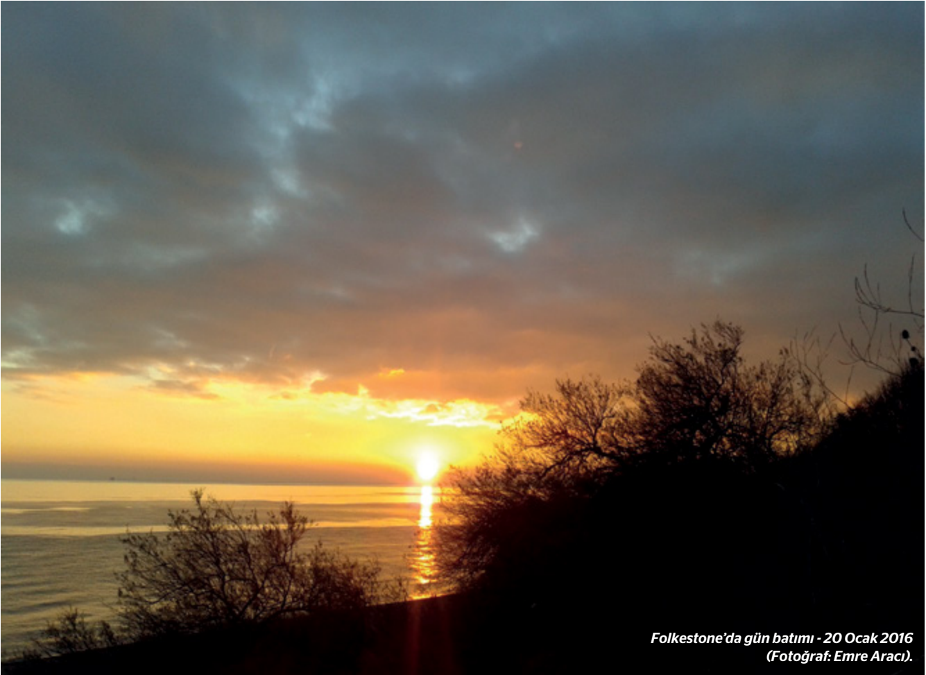
Folkestone'da gün batımı - 20 Ocak 2016.

tanık olabileceğimizi düşündüğüm bir anda Paris şehrinin yelkenli bir tekneyi dalgada betimleyen Roma devrine dayanan armasındaki Latince motto'yu anımsatıyor: “Fluctuat nec mergitur” - “sallanır ama batmaz”; tıpkı Gounod'nun Ave Maria 'sında Bach'ı yaşattığı, ya da unuttuğumuzu sandığımız o kıymetli hayatların ve insanların, çoktan silindiği sanılan hatıralarının kendi hayatımızda, batan güneşin ardından doğacak olan yeni güneş havasında, bir gün yeniden canlanabileceği ve zamanı geldiğinde de bir Paris günlüğüne yazılmayı bekleyen hikâyelere dönüşebileceği gibi... 📸