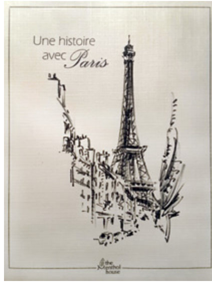
Une histoire avec Paris - Jacques Caspar'ın kara kalem çizimleri eşliğinde bir Paris günlüğü.

Sayfaları çevirmeye devam ediyorsunuz; Paris'in salyangoz gibi büyüyen 20 mahallesinin kara kalem haritası, Louvre Müzesi'nin cephesinden bir kesit, d'Orsay Müzesi'nin uzakta kaybolan ikiz saat kulesi, Notre Dame Katedrali'nden bir vista, Sacré-Cœur'ün basamaklarından ziyaretçiyi 1926'da kapılarını açmış Endülüslü mimarisindeki Paris Büyük Camii'nin minaresine taşıyan kalem çizimleri, yanbaşındaki güvercinleriyle öylece boş bir halde sizi bekleyen, sırt sırta oturan şehrin ikonik ikiz banklarından bir tanesi, bir başka sayfada gözünüze ilişen Passy'deki metro viyadüğü ve bu perspektifin Palais Royal'ın sütunlu galerisinde yürüdüğünüz bir anı ve Café de la Paix'yi size anımsatışı, Jardin de Luxembourg, Parc Monceau, canlı dev çiçekler gibi metroların girişlerini süsleyerek aydınlatan fenerler... Kitabın sayfaları baştan sona Paris'i yaşayan ve yaşatan çizimlerle dolu, ama önsözün sonrasında bulunabilecek tek bir satır dahi yok. Zira Caspar'ın resmettiği bu küçük