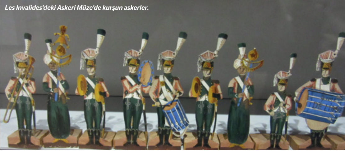
Les Invalides'deki Askeri Müze'de kurşun askerler.