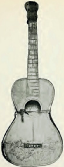
Gounod'nun üzerine "Nemi, 24 Nisan 1862, mutlu bir günün hatırası" yazdığı gitar.