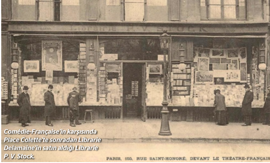
Comédie-Française'in karşısında Place Colette'te sonradan Librairie Delamaine'in satın aldığı Librairie P. V. Stock.

PARIS, 155, RUE SAINT-HONORÉ, DEVANT LE THEATRE-FRANCAIS