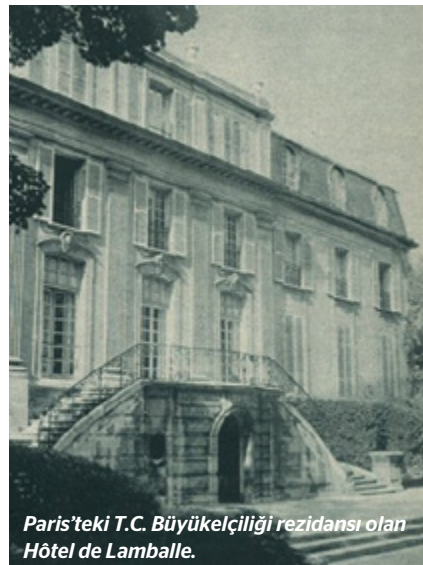
Paris'teki T.C. Büyükelçiliği rezidansı olan Hôtel de Lamballe.