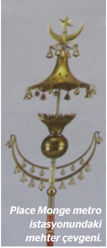
Place Monge metro istasyonundaki mehter çevgeni.

yor”. 18. yüzyıldan kalma Fransız yapımı büyük bir mehter çevgeni ve müzede bu enstrümanı taşıyanların da aralarında bulunduğu yüzlerce minyatür kurşun asker Librarie Delamain'de bularak başladığım Paris günlüğümün sayfaları arasına peş peşe sıraladığım hikâyeler zincirinin son halkaları olarak eklenirken soğuk bir kış akşam üzeri makaleme ara vererek gün batımında The Leas kıyısında Gounod gibi yaptığım bir yürüyüşte denizin üstünde altın ve bakır karışımı bir kırmızılıkta batan güneşin aksinde yuvaya dönen aheste bir yelkenli görüyorum. Tıpkı Egmont Uvertürü 'nü