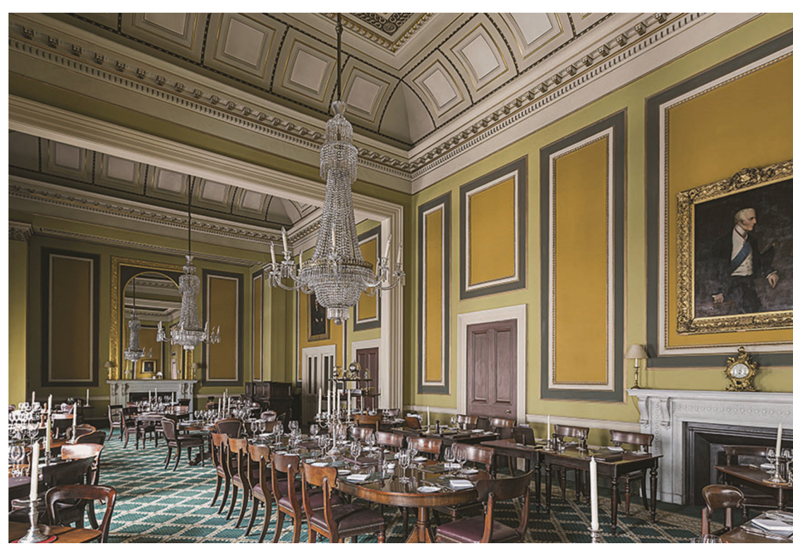
The Travellers'in 'Coffee Room' yemek salonu

öldü: Pera'da kendi adıyla anılan İtalyan Tiyatrosu'nun sahibi ve emprezaryosu Bay Michael Naum" cümlesiyle açılıyordu bu haber. Yani Beyoğlu'nun Naum Tiyatrosu'na adını veren ve kimi yerel Osmanlıca gazetede adının sıklıkla geçtiği şekliyle "Hoca Naum Efendi" bir zamanlar Downing Street'te yaşamış olan Lady Hester Stanhope'un hizmetinde çalıştığı gibi, 1868'de İstanbul'daki vefatı, The Athenaeum 'dan kaynaklı olarak, onlarca İngiliz yerel taşra gazetesine de dağılırarak, en nihayetinde The New York Times 'in sütunlarına da ulaşmış dünya haberi oluvermişti. The Athenaeum dergisinin haberine göre Halepli bir tüccarın oğlu olan Michael Naum on dört, ya da on beş yaşlarında Lady Hester'in dikkatini çekmiş ve maiyetine katılarak Suriye'ye gitmişti. Naum'un, Lady Hester'in himayesindeki resmi görevi "dragoman", yani tercüman olarak biliniyordu, ama The Athenaeum 'daki o haberi kaleme alan