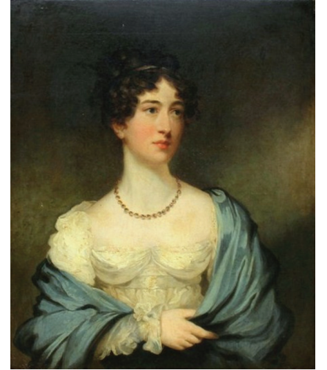
Doğuya seyahat etmeden önce Lady Hester Stanhope, (William Beechey)

Kraliçesi" olarak anılmaya başlamıştı. Ancak zaman içerisinde İngiltere'den kesilen maaşı, ilerleyen yaşı ve himayesindekilerin yavaş yavaş her şeyini çalmaları sonucu kimsesiz ve düşkün bir hâlde, sefalet içerisinde 1839