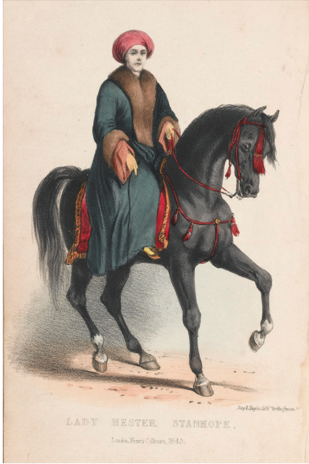
'Çöl Kraliçesi' Lady Hester Stanhope (Henry Colburn, 1845)

tuğla cephesi ve taçlı fenerli o ikonik siyah kapasıyla bugün de değişmeyen İngiltere'nin en önemli sembollerini arasında olduğu üzere, burada toplamda 20 yıl yaşamış olan Genç