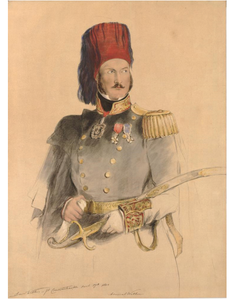
'Walker Bey', Amiral Sir Baldwin Walker (Sir David Wilkie, 1840)