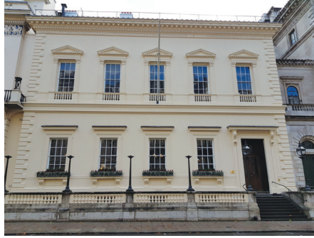
106 Pall Mall'daki The Travellers Club

Londra'nın en tarihi ve görkemli centilmen kulüplerinden 106 Pall Mall'daki The Travellers'ın 1904'ten kalma orijinal asansörünün sürgülü kafes kapısını kapatıp da çatı katındaki odama çıkarken ve dışarıda yağmur hafif hafif pencerelere çarparken bir anda karşıdaki duvarda ressam Sir David Wilkie'nin fırçasından çıkma portresi gözüme çarpan fesli üniforması içerisindeki Walker Bey, daha doğrusu Amiral Sir Baldwin Walker (1802-1876), Londra'da Türk İzleri kitabımı iki yüz yıllık kütüphanesinde anlatmaya geldiğim bu eşsiz mekânda beni karşılayan hiç beklenmedik bir ev sahibi olarak karşıma çıktı. Zaten beni de buraya getiren Londra'nın kalbindeki bu centilmen kulübünün böylesine zengin, Doğu-Batı arasında girift, tarihi ve kültürel dokusundan başka bir şey değildi. The Travellers 1819 yılında Dışişleri Bakanı Lord Castlereagh (1769-1822) tarafından Napolyon devri savaşlarını takip eden Viyana Kongresi'nin hemen ardından kurulmuştu ve 'Seyyahlar Kulübü' anlamına gelen adından da anlaşıldığı üzere üyelik koşulu olarak adaylardan Londra'dan düz bir çizgi halinde çizilecek 500 mil mesafe ötesindeki bir coğrafyaya seyahat etmiş olmaları beklenmekteydi. Dolayısıyla o devir Osmanlı topraklarına seyahat etmiş pek çok asilzade ve diplomata bu derneğin kapıları açıktı. 31 Ekim akşamı kulüpte verdiğim konuşmamdan daha bir hafta öncesinde döndüğüm İstanbul'un Tepebaşı'ndaki İtalyan Kültür Merkezi, Casa d'Italia'nın sahnesinde, Levantenler Konferansı'nda Naum