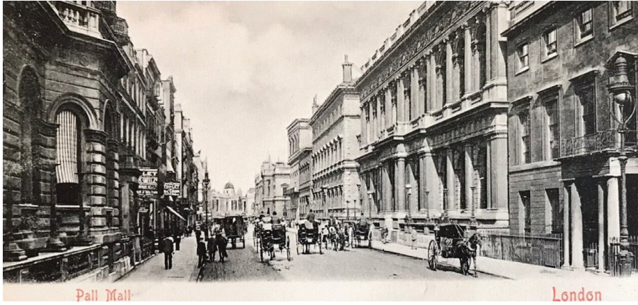
1900'lerin başında Pall Mall ve centilmen kulüpleri