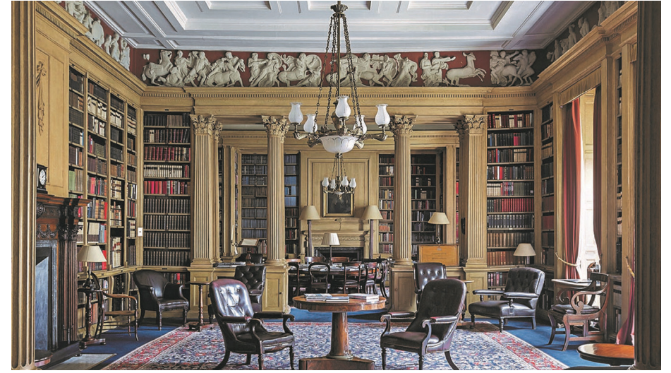
The Travellers'in tarihi kütüphanesi

Dayısının 1806'da 46 yaşındaki ani vefatının ardından Lady Hester, Oxford Street'in hemen kuzeyindeki Marylebone semtindeki Montagu Square'e taşındı. Ancak bir hayli maceracı bir yapıya sahip olduğu için ve geçmiş makalemin konusu olan Lord Byron'dan da fazlasıyla etkilenerek 1810 Şubat'ında Londra'dan ayrılarak Doğu'ya seyahat etmeye karar verdi. Esas amacı, Napolyon'un işgalinden sonra Mısır'a ulaşmaktı. Bu yolculuğunda, sonradan hayat öyküsünü kaleme alacak olan doktoru Charles Lewis Meryon, nedimesi Anne Fry ve sevgilisi Michael Bruce da ona eşlik ediyorlardı. Ama bir daha İngiltere'ye hiç geri dönmeyeceğinden de o zaman elbette ki habersizdi. Lady Hester ve maiyeti 1810 sonbaharında İstanbul'a vardılar. Yangınlardan dolayı ev bulamadığı Beyoğlu'nda yaşamak istememiş ve Tarabya'da Boğaz'a hâkim eski bir Türk evine yerleşmişti. Zaman zaman yerel giysiler içerisinde erkek kılığına girerek sokakları dolaşırdı. İstanbul sokaklarında renkli bir karakter olmalıydı. 6 ay sonra İstanbul'dan ayrılarak Mısır'a geçti ve oradan da ömrünün sonuna kadar yaşayacağı Lübnan'ın Djoum köyüne yerleşti. Lady Hester artık "Çöl