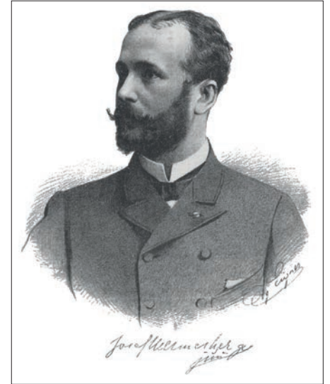
Oğul Joseph Hellmesberger, (Ignaz Eigner, 1887)

sessiz ve sakin bir ortamda bestelerini notaya dökebileceği küçük bir kulübe inşa ettirmişti.