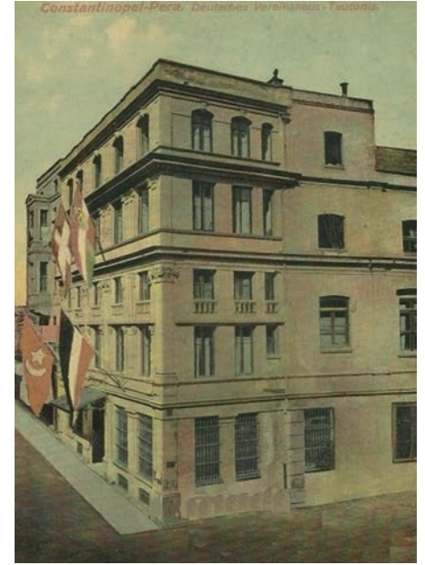
Beyođlu'ndaki Alman Derneđi Teutonia'nın binası