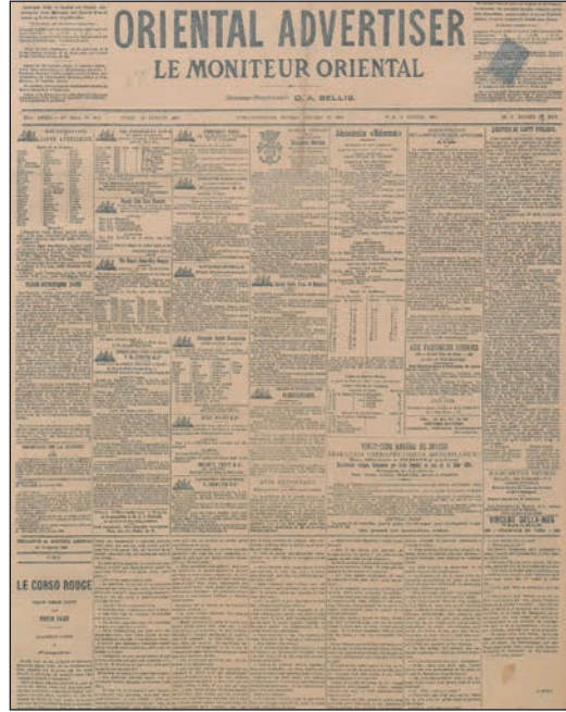
1894 yılından 'The Oriental Advertiser - Le Moniteur Oriental', (Salt Galata Arşivi)

Ve İstanbul'dan kilometrelerce uzakta, İngiltere'deki bilgisayarımın başında, Salt Galata Arşivleri'ndeki eski İstanbul gazetelerini, geçen yazımda Hans von Bülow'la ilgili alıntı yapmış olduğum 1894 yılının The Oriental Advertiser - Le Moniteur Oriental gazetesinin sayfalarını bıraktığım yerden çevirmeye devam ediyorum. O günün gazete sütunlarına konu olmuş ve günümüz şuurlarından çoktan silinip gitmiş o cânım konserlerin sesleri, solmuş gazete yaprakları arasında âdeta kurutulmuş çiçekler