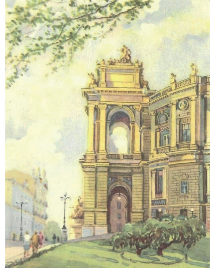
Odessa'nın tarihi opera binası

Edvard Grieg'in Hardanger Fiyordu kıyısından Schubert'in Erlkönig 'ine, Beethoven'ın Appassionata 'sından Chopin'in Paris'ini anımsatan etütlere 1894 yılının karlı kış sezonundan yitik sesler işte böyle geliyor yıllar sonra kulaklara. O sesler arasında yaşıyor! Tam da o sırada aynı gazetenin ilan sayfalarında Messageries Maritimes Şirketi'nin İstanbul-Odessa hattında çalışan buharlı gemilerinin günlük tarifleri gözüme çarpıyor. En son konserimi beş sene önce verdiğim Odessa'da şehrin o muhteşem opera binasında Donizetti'nin Aşk İksiri 'ni izlediğimi hatırlıyorum. Şu an o coğrafyadan gelen görüntüler karşısında herkes gibi ben de derin bir üzüntü duyuyorum. Keşke insanoğlu hep güzelliklerin izinde gitse ve o güzellikler sararıp solmuş gazetelerin satır aralarında kalmasa diye düşünüyorum. Ama o zaman da sanat olur muydu? Nitekim Adam Zamoyski, Chopin için şöyle yazmış kaleme aldığı beste-