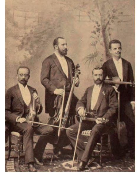
1890'lı yıllarda Hellmesberger Kuarteti (İstanbul'a gelen kadro)

Hellmesberger Kuarteti İstanbul'a geldiğinde şehirde kolera salgını hâkimdi. 15 Şubat'taki ilk konserlerinin haberi 8 Şubat tarihli Le Moniteur Oriental'de duyurulduğunda bir üst satırda son bültene göre koleradan İstanbul'da 13 kişinin hayatını kaybettiği yazılıydı. Gümüşsuyu Hastanesi'nde, Kasımpaşa, Elmadağ ve Pangaltı'da ölümler olmuştu. Akşam saat 21:00'de başlayan konser Beethoven'ın Op.74, Mi bemol Majör kuartetiyle açılacaktı. Bunu Mozart'ın Andante 'si, Boccherini'nin Menuet 'i ve Grieg'in Op.27, Sol Minör kuarteti takip ediyordu. Grieg, bu eserini 1877-78 yılları arasında Norveç'in batısındaki Hardanger'de bestelemişti. Norveçli romantik ressam Hans Gude'nin 1847 tarihli Hardanger Fiyordu tablosuna bakıyorum da Grieg'in o coşkulu, lirik kuartetinin ancak böylesine bir manzaranın ilhamıyla yazılabileceğini düşünüyorum. Hatta Grieg bu manzaradan o kadar etkilenmişti ki Lofthus Köyü'nde herkesten uzak,