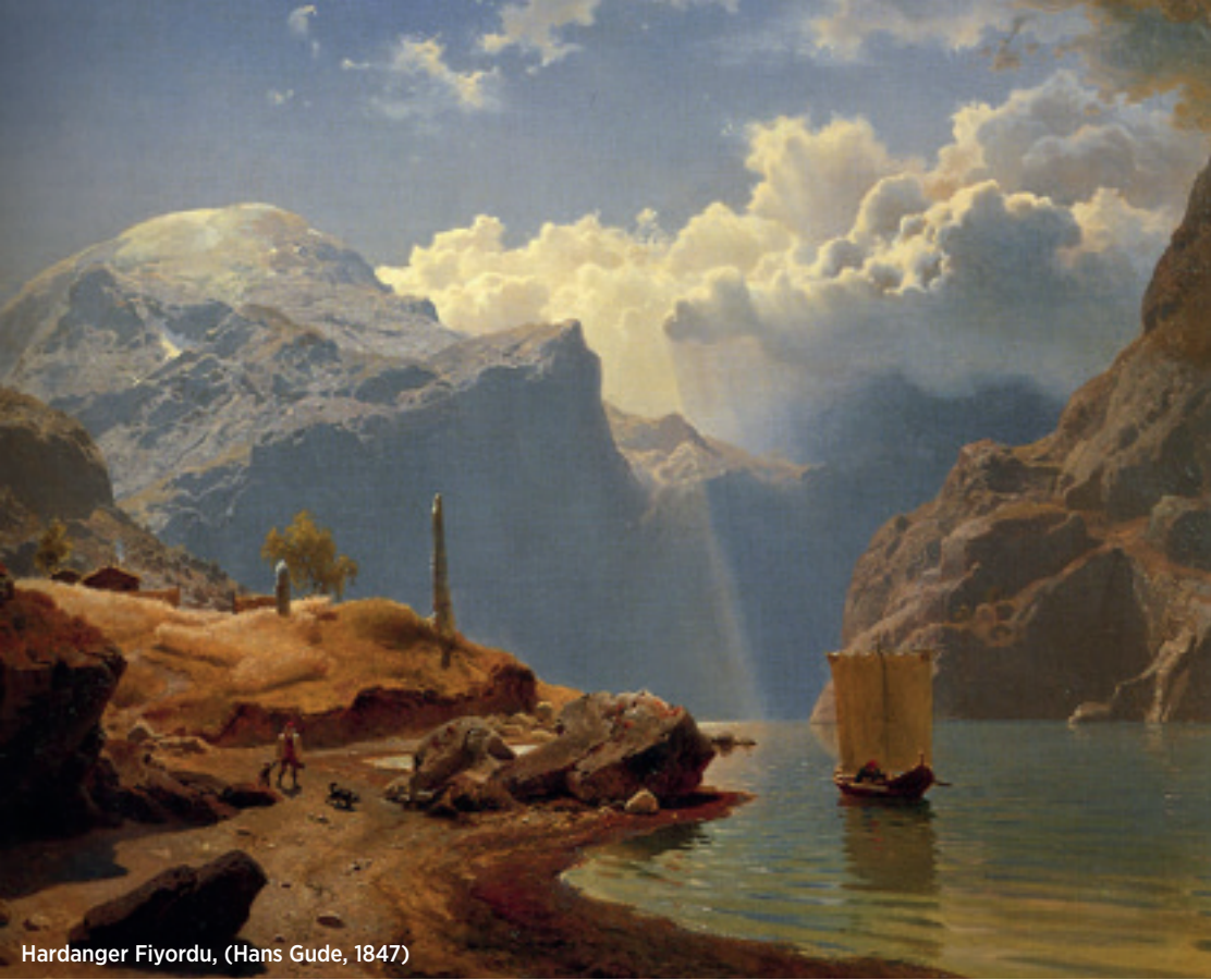
Hardanger Fiyordu, (Hans Gude, 1847)

Bugün Ullensvang Otelı'nin bahçesinde bulunan bu küçük kulübede bestelemiřti Sol Minör kuartetini de. Eserin prömiyeri 1878 Ekim'inde Köln'de gerçekteřmiřti. Dolayısıyla Grieg'in kuarteti, besteleniřinden 16 yıl sonra İstanbul'da seslendirilirken esasında devri açıısından "çağdař" bir kompozisyondu.