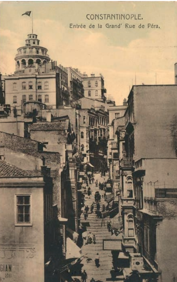
Pera'ya tırmanan Yüksek Kaldırım