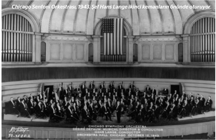
Chicago Senfoni Orkestrası, 1943. Şef Hans Lange ikinci kemanların önünde oturuyor.