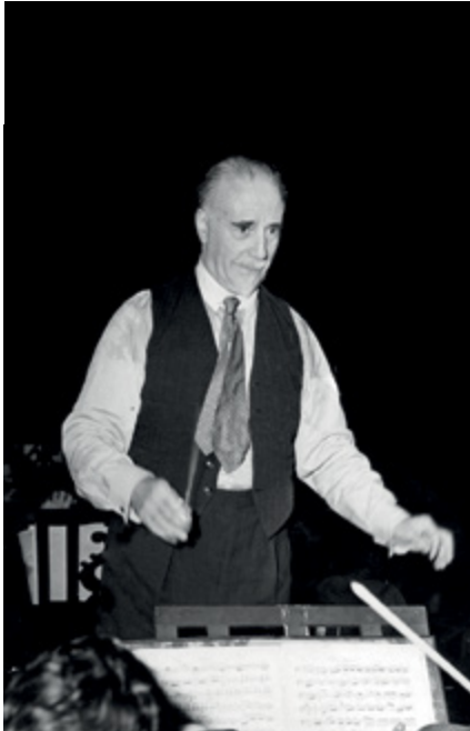
Sir Thomas Beecham

“still living” (hayatta) ibaresini okuyorum. Programda bir detay daha dikkatimi çekiyor; konserde seslendirilen eserlerin partiyonlarının New York Halk Kütüphanesi'nin 58. Cadde'deki şubesinden evde çalışmak üzere temin edilebileceği yazılı; 1930'ların dinleyicisi bu kadar meraklı ve entelektüel.