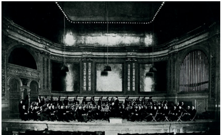
Walter Damrosch idaresindeki New York Filarmoni Orkestrası Carnegie Hall'da, 1902