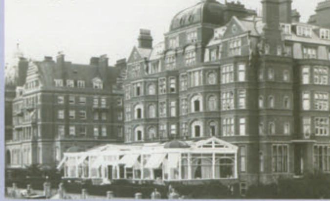
İngiltere'de yaşadığı mekân: The Grand