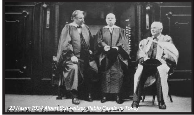
23 Kasım 1934 Albert Schweitzer, Pablo Casals ve Tovey