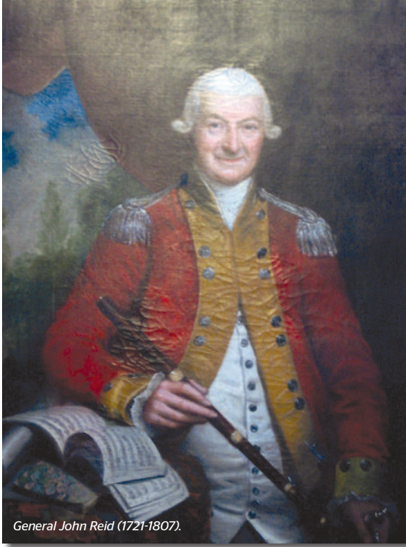
General John Reid (1721-1807).

EUSO, şefliğini benim yaptığım dönemlerde Ahmed Adnan Saygun, Ulvi Cemal Erkin ve Cemal Reşit Rey'in eserlerini de zaman zaman konserlerinde çalardı; Sultan V. Murad'ın bestelerini orkestrasyonlu olarak 1997deki özel bir konserde Edinburgh'da ilk defa seslendiren de EUSO oldu. Dolayısıyla 20. yıl konserinde öğrencilerin bu geleneği sürdürüyor olmaları beni bir hayli duygulandırdı.