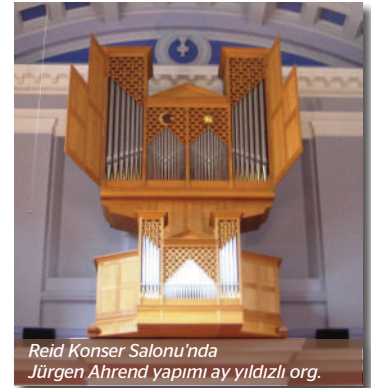
Reid Konser Salonu'nda Jürgen Ahrend yapımı ay yıldızlı org.