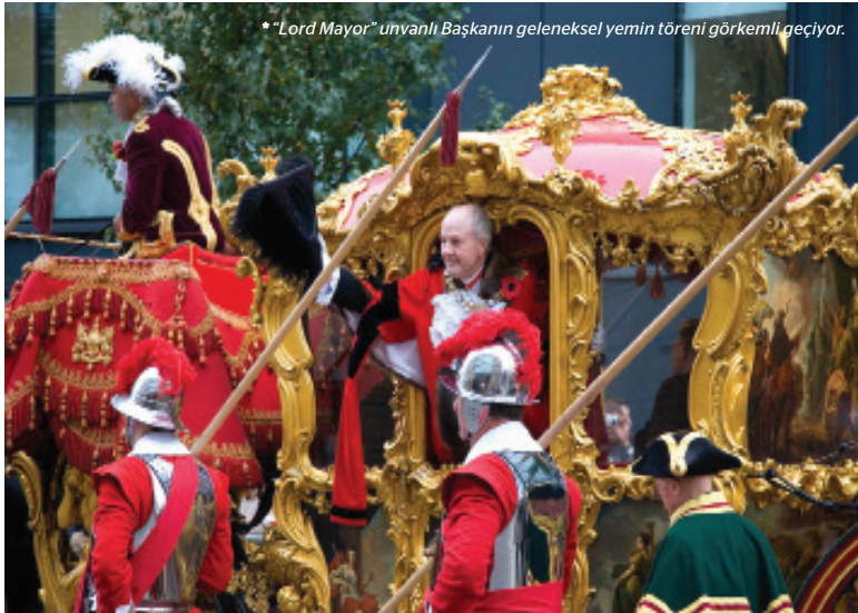
*"Lord Mayor" unvanlı Başkanın geleneksel yemin töreni görkemli geçiyor.

"Lord Mayor" unvanını taşıyan ve her yıl belediye meclisi tarafından meclis üyeleri arasından seçilen başkan, törenlerde kürk yakası, kırmızı cübbesi ve tüylü üç köşeli şapkasıyla göze çarpar. Eski Phantom Rolls Royce'u ile Londra sokaklarında dolaşırken ortaya çıkan manzara ise, tarihi bir film karesi gibi gelir insana; geleneksel yemin törenine başkan, adeta Papa gibi miğferli ve mızraklı korumalarının eşliğinde altı atın çektiği 1757'den kalma altın at arabasıyla gider. Ve bu gelenek Londra sokaklarında sürüp gider. Belki de tüm zamanlar içinde her şeyin süratle değiştiğini en fazla yaşadığımız bu çağda, kimilerine bu seremoniler son derece lüzumsuz gelebilir, ancak şu an itibarıyla Londra'da hiç olmazsa devam ettiğini görmek bu değerlere değer veren insanlara teselli oluyor. Nedense bu geleneklerden geleceğe atılan adımlar daha sağlam olacakmış gibi geliyor; Shakespeare'in ruhunu hissettiğiniz Londra sokaklarında geçmişten gelen bu organik bağ, asırlardır devam eden yerel bir karakteristiğin kişilikli bir şekilde devam ettiğini gösteriyor. Hele bir de 21. yüzyılda böyle bir seremoninin şahsen parçası olmak; işte o zaman olay tarifsiz bir boyuta ulaşıyor.